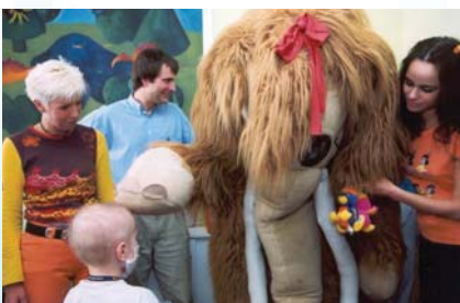
Velikonoce v Motole - 28. 3. 2002