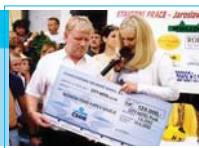
Dětský den s hotelem City v Písku 1. 6. 2002