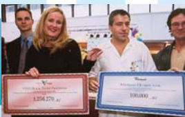
Vánoční show v Motole - 19. 12. 2002