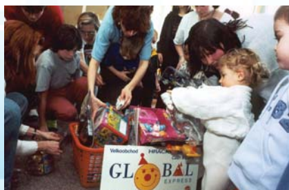
Velikonoce v Motole - 28. 3. 2002