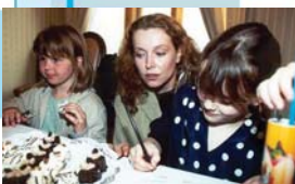
Návštěva dětí v Parlamentě ČR - 18. 3. 2002