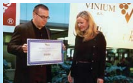
Vánoční show v Motole - 19. 12. 2002