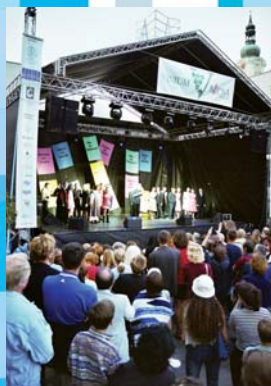
Koncert „Noty z filmů“ - 5. 7. 2002